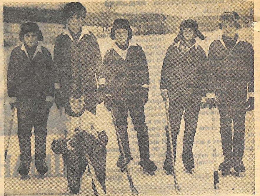
«СОЛОТА ШАЙБА». Не одне хлопчаче серце хвилюється при цих словах! Хто не мріє виграти цей почесний приз, боротьбу за який розпочали десятки вуличних і дворових команд області. Обком комсомолу разом з обласною радою Союзу спортивних товариств і організацій прийняли рішення про проведення таких змагань. Першими взяли старт юні хокеїсти Новоград-Кіровоградського району. Найсильнішими серед них виявилися хлопчики команди «Буревісник» з вулиці Орджонікідзе солища Новоградки. Переможцям вручено кубок райкому комсомолу.

На фото ви бачите тринадцятилітніх хокеїстів з команди «Буревісник».