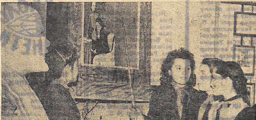
Школярі Ганнінської середньої школи Кіровоградського району виготовили стенди, панно, плакати про життя і діяльність В. І. Леніна. І тепер порадитися з вождем приходять в Ленінську кімнату і комсомольці, і піонери.

На нараді затверджено раду молодих спеціалістів сільського господарства при обкомі ЛКСМУ. Групі молодих активістів — спеціалістів сільського господарства було вручено Грамоти.