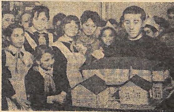
Подарунок 10-го «А».