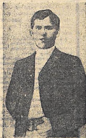
В громах імперіалістичної війни в окопному сидінні наростало в Чапаєві, як

Він був доброї честності. Брехні, в чому б вона не проявилася, не терпів і тоді був суворим. Якщо хто хоч раз спробував його обдурити, ввести в оману, той назавжди мусив прощатися з повагою і довірою Василя Івановича.