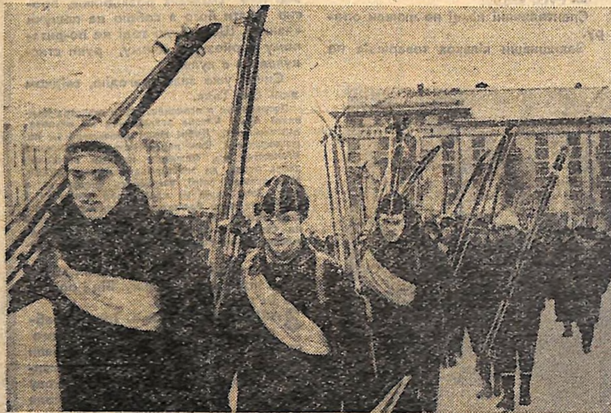
Зараз автобуси вивезуть лижників за місто, і засніженими полями, долаючи зустрічний вітер, вони підуть своїми маршрутами.

ЧЕПЧИК прокинувся в зудесному пастрої. І не безпричинно. По-перше, була неділя. По-друге, з кухні смачно пахло млинцями. Ну, а по-третє... Чепчик обережно розсунув рожеву фіранку і зачаровано запер: мажорно сяяло сонце, мажорно — вжж, вжж, — скаржився сніжок під ногами перехожих, і