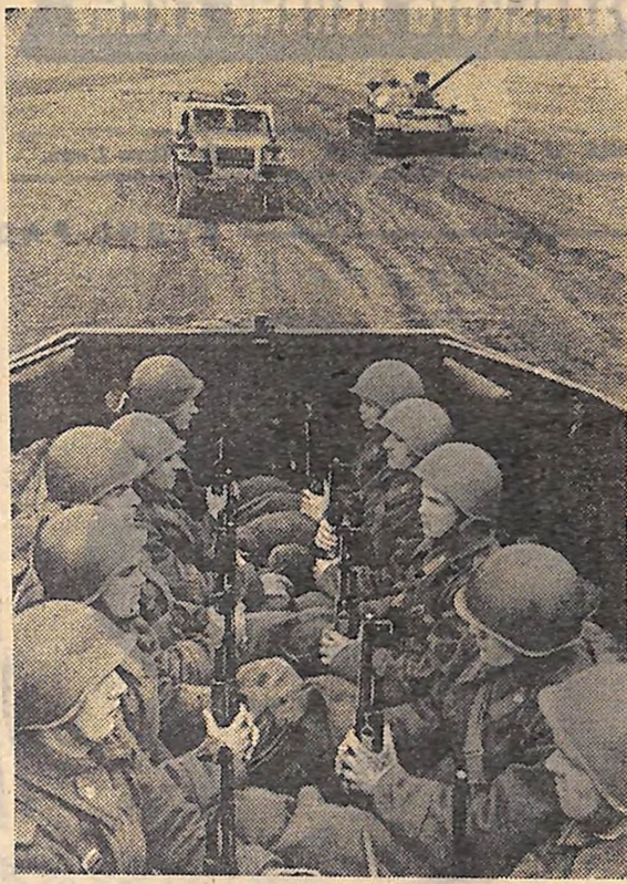
Одеський військовий округ. На тактичних заняттях.