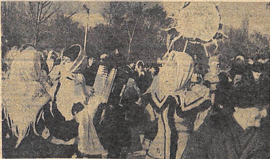
Коли в танку, і мороз — не мороз.

Репортаж про свято п'ятдесяти зими читайте на 2-й сторінці.