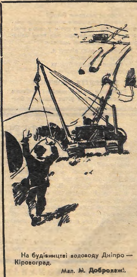
На будівництві водоводу Дніпро — Кіровоград.

І. БАБАНСЬКИЙ, Інспектор шкіл обласного відділу народної освіти.