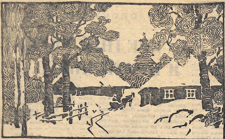
ДЕСЬ БІЛЯ ЗНАМ'ЯНКИ...