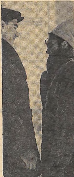
«А ти не зрадливий!»