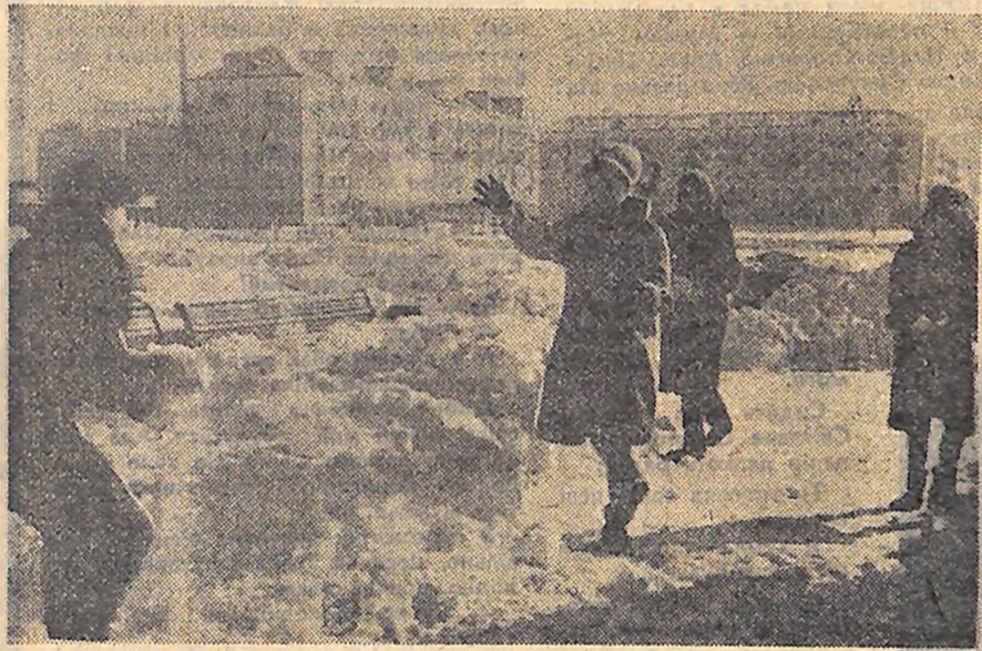
Тримайтеся, хлопці — наступають швейники.