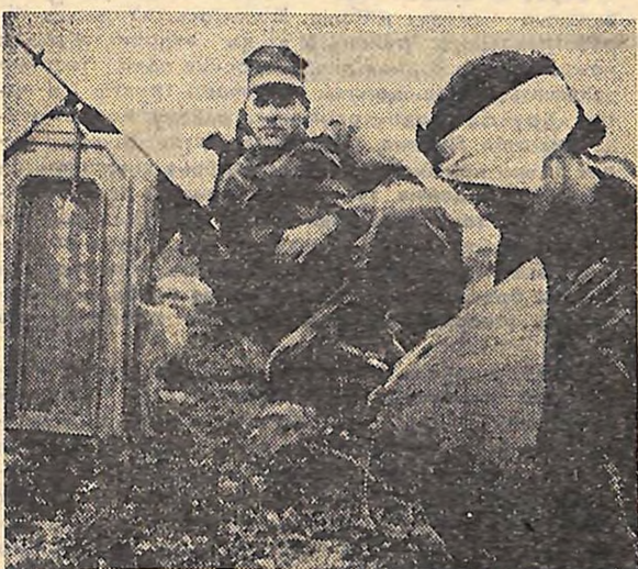
Південний В'єтнам. Арешти і вигнання мирного населення — частина тактики опаленої землі, яку застосовують американські агресори у Південному В'єтнамі. Арештові підлягають усі, хто може опинитися в районі воєнних дій, незалежно від віку і статі.

На знімку: ось проти кого воюють солдати американської морської піхоти.