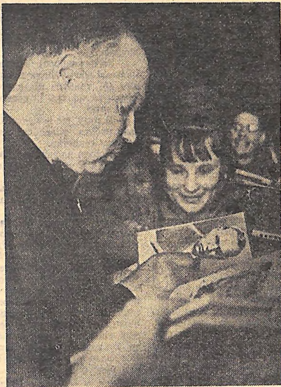
Автографи, автографи...

З кожним днем все відчутнішим стає подих тепло-го вітру. Разом з його віянням приходять до нас нові турботи. Отож, ровеснику, як солдат перед боєм, перевір бойову готовність. Як вчений в лабораторії, добери для засіву найвагоміші янтарні зерна. Перейми мудрість старого хлібороба, порадься з рекомендаціями по найновіших методах господарювання. І тоді скажи впевнено: «Приходь до нас, весно!»