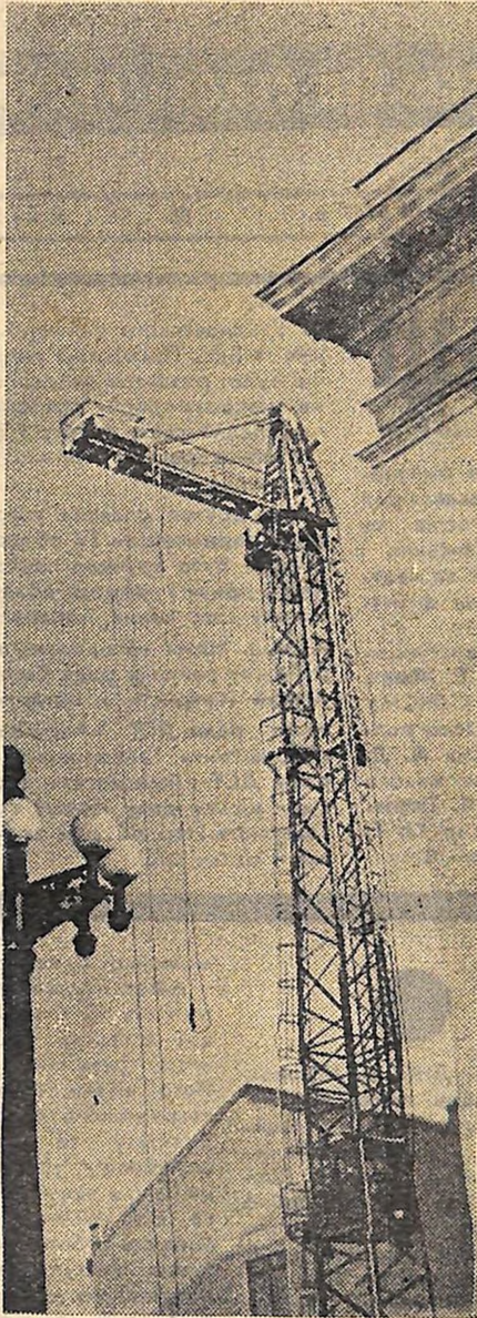
Кіровоград будуватиме. Під вулицю Карла Маркса і Тімірязєва.

Н. РИБАЛКО, референт обласної організації товариства «Знання».