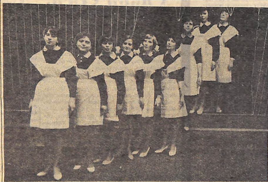
Десятикласниці Малописківської середньої школи № 3 — учасниці ансамблю «Юність». Вже кілька років цей ансамбль радує глядачів веселою піснюю.