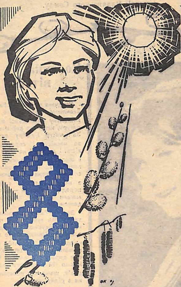
Мал. В. Колісниченка.

ВАМ, ДОРОГІ СТЕПІВЧАНКИ, ВЕЛИХ, НАПОВНЕНИЙ СОПЦЕМ, ДОБРОМ І ЩАСТЯМ!