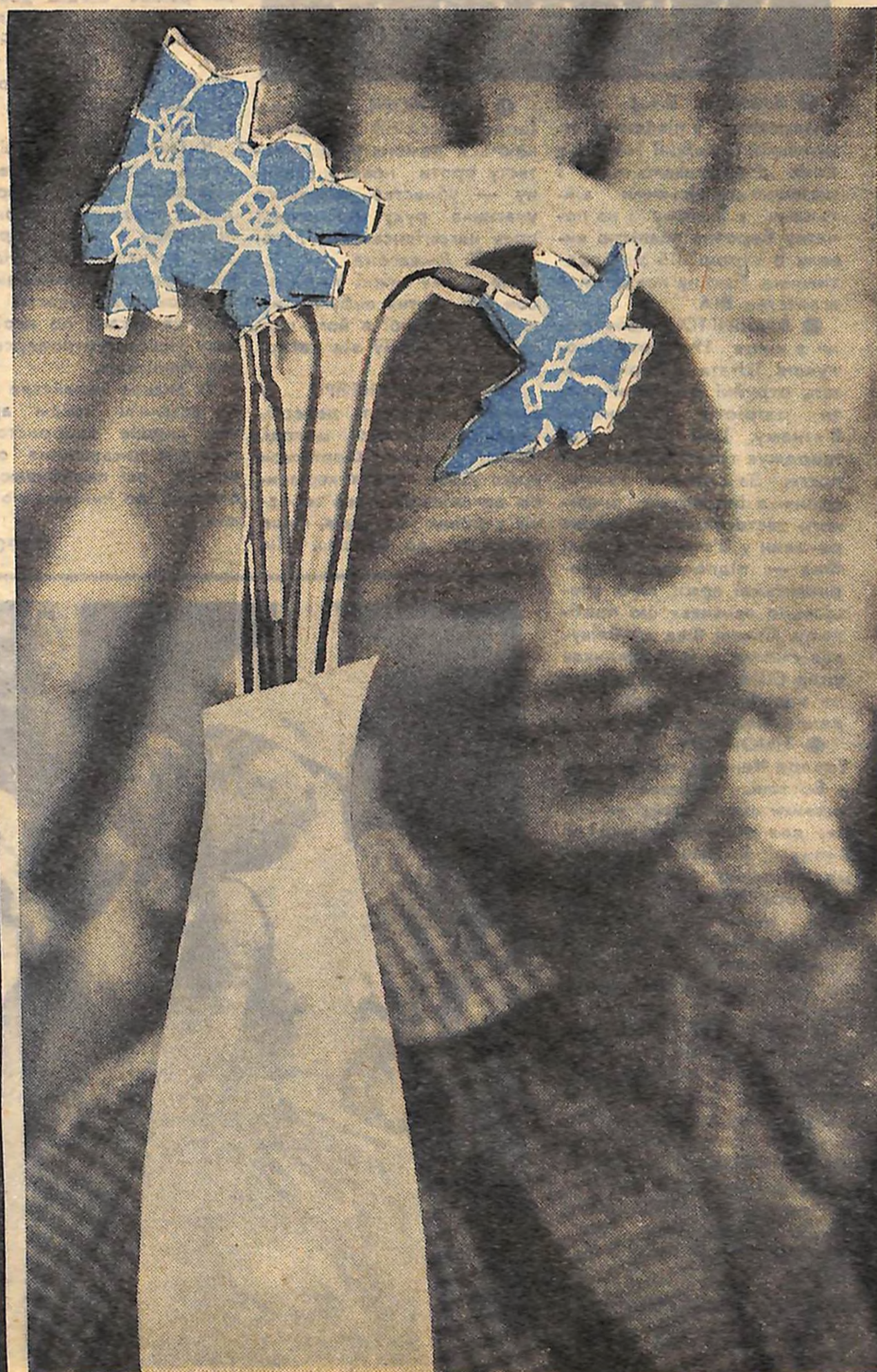
ХАЙ КВІТАМИ СТЕЛИТЬСЯ ШЛЯХ

Додержуючи заповітів Володимира Ілліча Леніна, радянські жінки нарівні з чоловіками беруть активну участь в усіх державних справах: у розвитку і прийнятті (Закінчення на 2-й стор.)