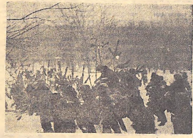
Вирішальна атака «червоних».