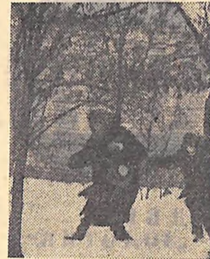
Ой, десь стогне поранений!

Ф. ПРОКОПЕЦЬ, старша піонервожата школи № 14, м. Кіровоград.