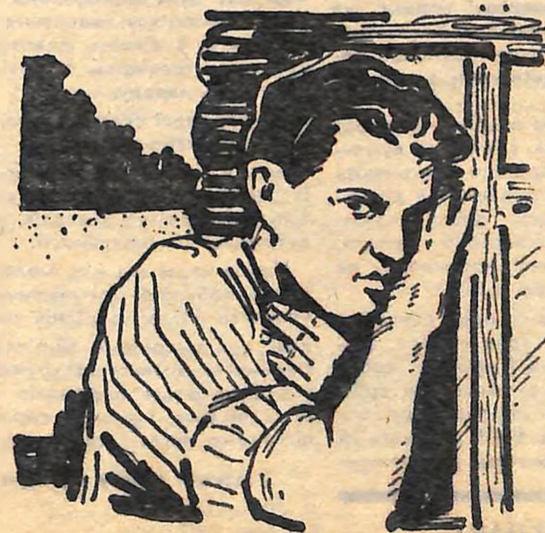
Малюнок М. ДОБРОЛЕЖИ.