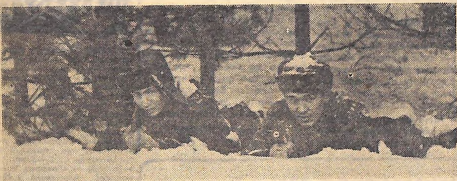
Наступ треба прикрити «вогнем».

— Будь ласка. «Тополя», про яку запитує багато молоді, вміщена в журналі «Пісні радио и кино», випуск 75. У цьому ж журналі (випуск 64) вміщено пісню «Красивые слова», у випуску 68 — «Морзянку», у випуску 66 — пісню «Голубая тайга», у випуску 88—89 — «Над Кронштадтом туман». Пісню «Я назову тебя зоренкой» вміщено в журналі «Культпросветраба» № 4 за 1964 рік, а «Как провозжат пароходы» — в «Молодежной эстраде» № 1 за 1966 рік.