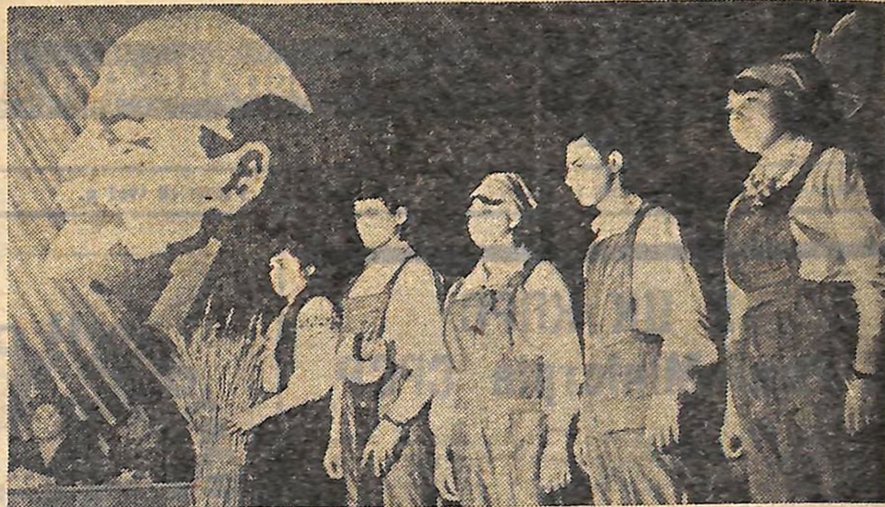
Ангелівці вітають учні профтехучилщи Кіровограда.