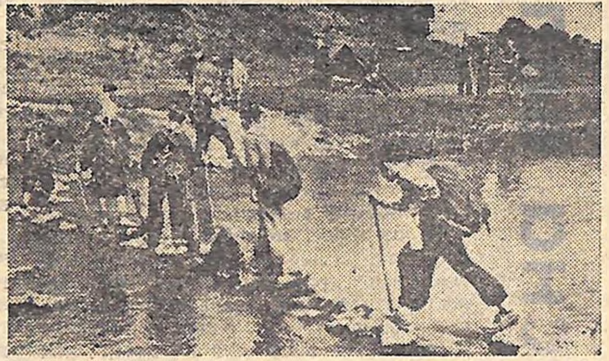
Юні туристи, учні Фурманківської середньої школи Новоукраїнського району, в поході.

Кіровоград — Мала Виска — Надлак — Новоархангельськ — Голованівськ — Ульяночка — Завалля — Вільшанка — Кіровоград (384 км).