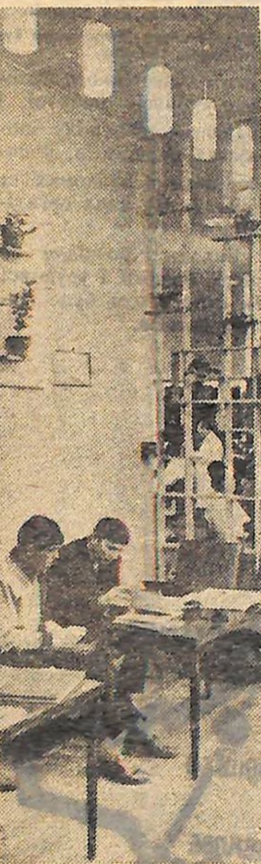
Яну ж зачіску вибрати!