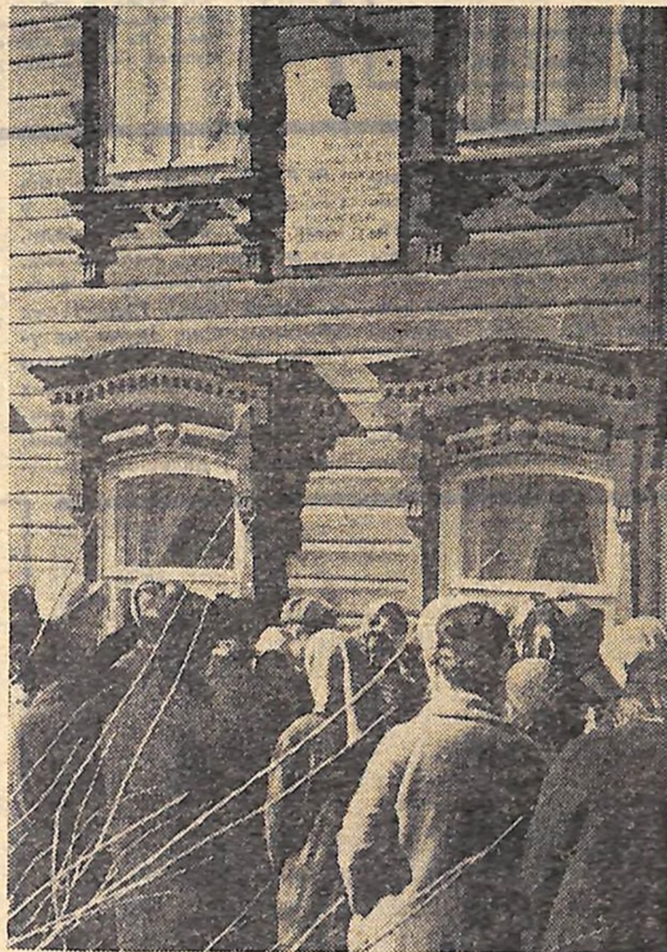
Учні, що подорожували туристсько-екскурсійним поїздом «Кіровоград», маршрут якого пролягає по ленінських місцях, привезли з собою хмляючі записки в щоденниках і фотографії — пам'ятки про хвилини зустрічей. На фото: кіровоградські школярі біля будинку в місті Ульяновську, в якому народився В. І. Ленін (вгорі), та біля будинку в м. Куйбишев, де Володимир Ілліч працював в окружному суді.