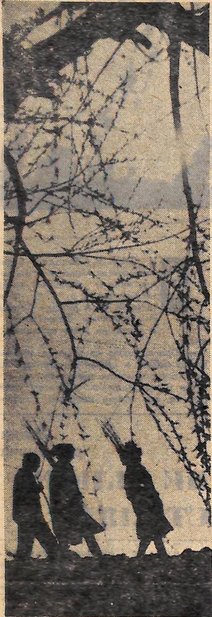
Вибухнула брумьками верба у вибалку, а внче, на косогорі, кудя йдуть ці трое, з'явля- ється ювілейні її сестрички та брати.

ТРАДИЦІЙНА дружба зв'язує кіровоградців з трудящими Толбухінського округу Народної Республіки Болгарії. Щороку сотні туристів з нашої області з великим інтересом знайомляться з живописною Болгарією і досягненнями болгарів. Приїзд болгарських друзів — завжди значна подія і для жителів нашої області. Ось