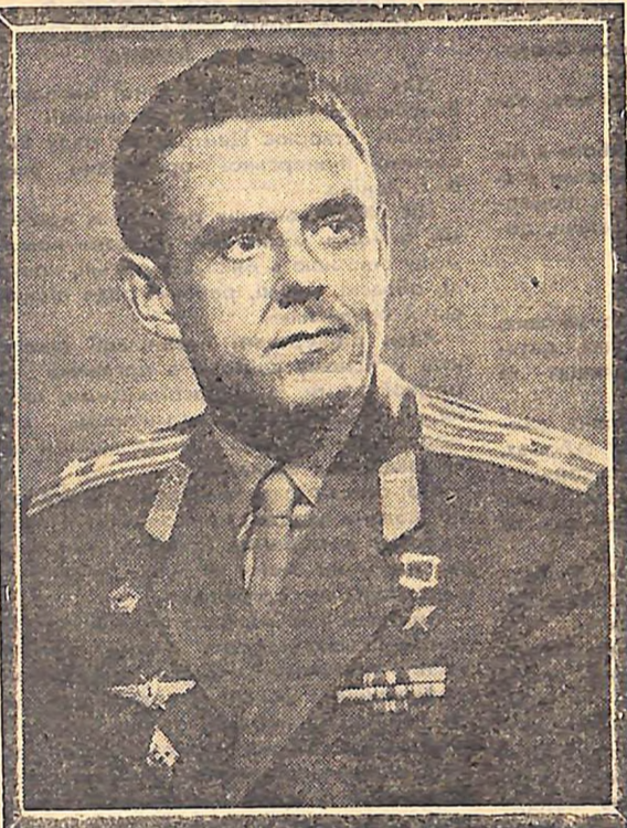
УКАЗ ПРЕЗИДІЇ ВЕРХОВНОЇ РАДИ СРСР

ЦЕНТРАЛЬНИЙ КОМІТЕТ КПРС ПРЕЗИДІЯ ВЕРХОВНОЇ РАДИ СРСР РАДА МІНІСТРІВ СРСР