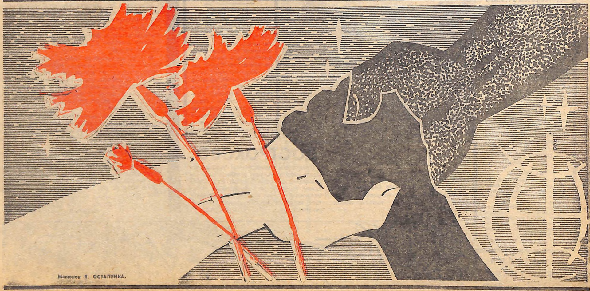
Малюнок В. ОСТАПЕНКА.

ський діяч Південно-Африканської Республіки; Давід Альфаро Сікейрос — художник, громадський діяч Мексики; Іван Малек — вчений, громадський діяч Чехословацької Соціалістичної Республіки; Рокуелл Кент — художник, громадський діяч Сполучених Штатів Америки; Герберт Варнке — громадський діяч Німецької Демократичної Республіки. (ТАРС).