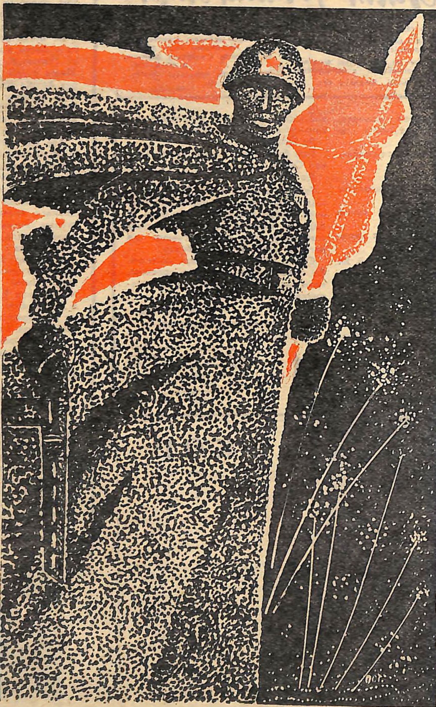
Малюнок В. ОСТАПЕНКА.