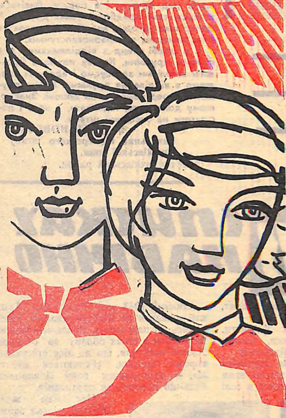
Малюнок В. ОСТАПЕНКА.