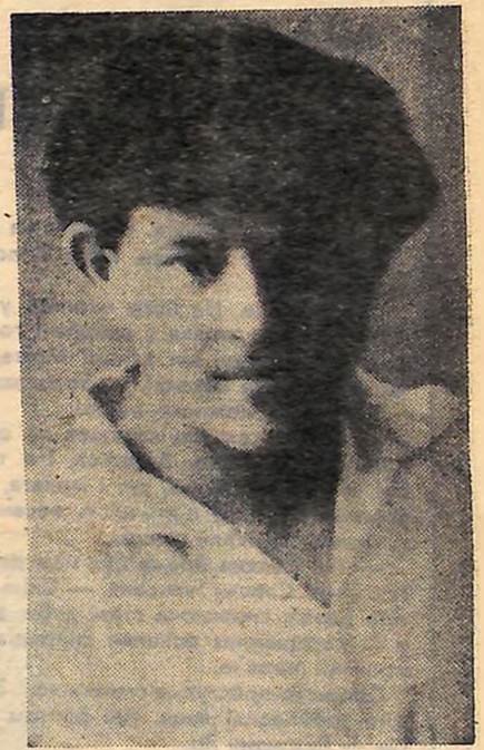
ЯКІВ МАСЛОВ. Фото 1920 року.

У липні Яків Маслов одержав призначення в