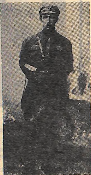
ГРИГОРІЙ КОЛОКОЛОВ Фото 1920 року.

З Бобринця вирушили назустріч Братському полку, що йшов на допомогу. Недалеко від Устинівки зустрілися з кінним загonom розвідки Тютюнника. 150—200 кіннотників, витягнувши шаблі, понеслися в атаку. Червоноармійці, опустивши гвинтівки, немов готуючись здатися, відступили до своїх підвід у лоцину. Коли ж вороги наблизилися, гримнули залпи, понеслися «ура». Бандити спішно повернули коней. Та багато з них залишилися лежати назавжди.