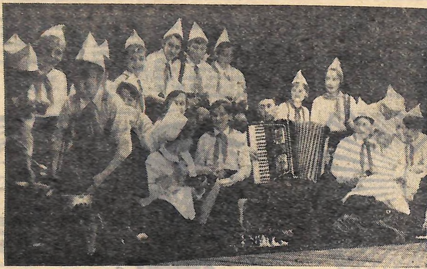
На огляді учнівської художньої самодіяльності Мадонського району схвалено глядачів і високу оцінку жорі здобув виступ піонерів-семикласників Великописарівської середньої школи. Наш позашкільний фотокореспондент В. Голічій сфотографував цей колектив. Звучить «Пісня юнаків».