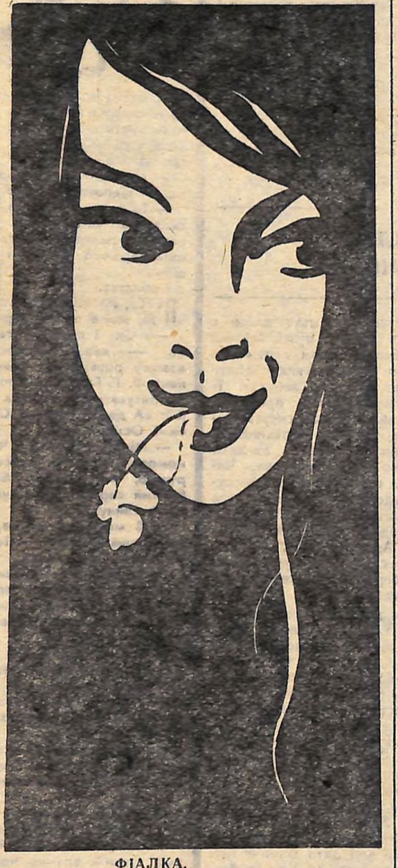
ФІАЛКА. Мал. В. ОСТАПЕНКА.

В. СОКУРЕНКО, працівник райгазе- ти «Будівник ко- мунізму». Маловісківський район.