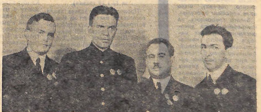
На фото: начальник першої в світі дрейфуючої наукової станції І. Д. Папанін, радист Е. Т. Кренкель, гідробіолог П. П. Ширшов, астроном Є. К. Федоров. (1938 рік). Матеріал про героїчний подвиг папанінців читайте на 3-й сторінці.