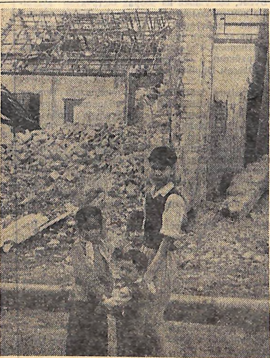
Демократична Республіка В'єтнам. В одному із життєвих кварталів Ханоя, зруйнованих американськими бомбардувальниками.