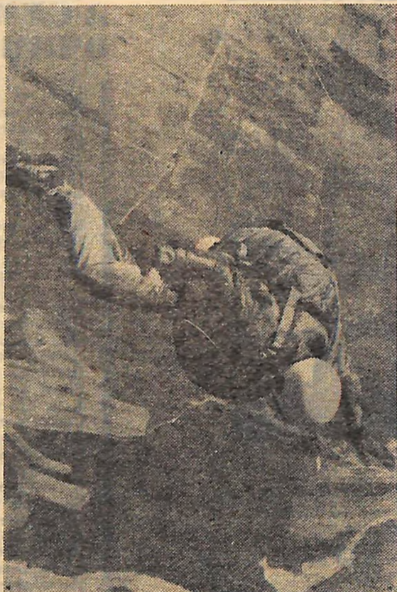
Одна... Дві... Три...