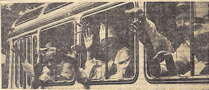
Літо — час подорожей.

стійна експозиція цілком складається з меморіальних речей, картин, гравюр, скульптур, рукописів, документальних матеріалів. (ТАРС).