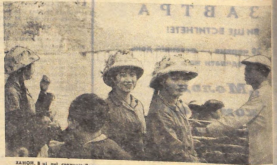
ХАНОЯ. В ці дні столицю Демократичної Республіки В'єтнам бомбардує американська авіація. Тільки-но прозвучить відбій повітряної тривоги — знову продовжують свою роботу підприємства, організації, торгують магазини. Стає людно на вулицях, в скверах і парках міста. На знімку: на березі озера Повернутого меча.