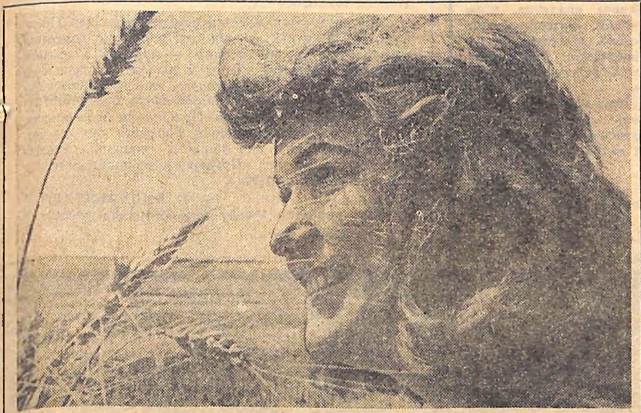
І дозріла радість степівчаники.