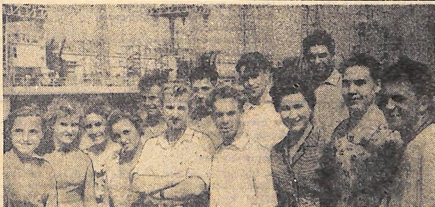
Це вони, комсомольці Кіровоградщини, засвітили зорі Кременчуцької ГЕС.

Вірний помічник партії, комсомол виконує з честю ленінські заповіді.