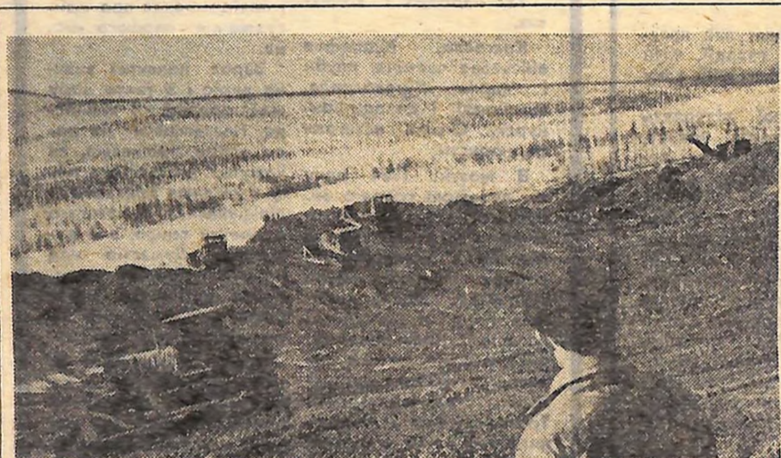
Поряд з Білібіно — крупним центром золотодобувної промисловості Радянського Союзу — на Чукотці будується атомна електростанція. Вона дасть струм шахтам і рудникам, селищам і містам цього суворого, але щедро наділеного природними багатствами краю.

Помер Айвазовський 19 квітня 1900 року. Л. ПУЗЕНКО, старший науковий працівник Кіровоградської картинної галереї.