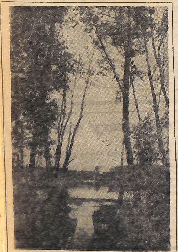
Над ставом тиша...

У старшій групі (1952—1953 рік народження) золоті медалі завоювали юні футболісти дніпропетровської команди «Дніпровець».