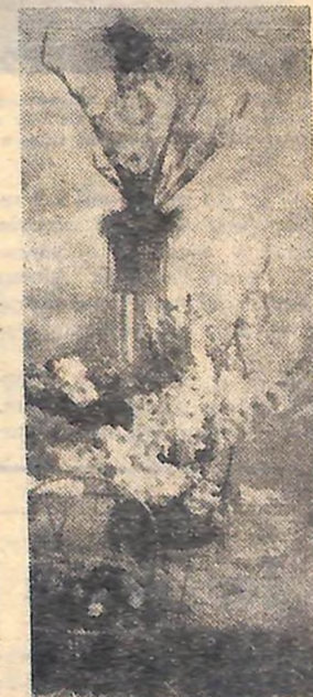
Вчора в Кіровограді в парку імені В. І. Леніна відкрилася виставка квітів. Про наймолодшого учасника виставки читають на 3-й стор.