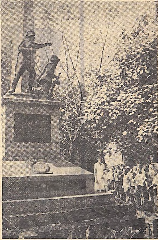
Група школярів з піонерського табору «Червоні пірляки» профспілки будівельників на екскурсії по місцях бойової, трудової і революційної слави в Кіровограді.

— ... До революції в Єлисаветграді було 56 лікарів. Зараз у місті 13 лікувальних закладів. На кінець п'ятирічки налічуватиметься близько 700 медпрацівників... Далі — про завод «Червону зірку», про агрегатний. — А тепер зробимо подо-