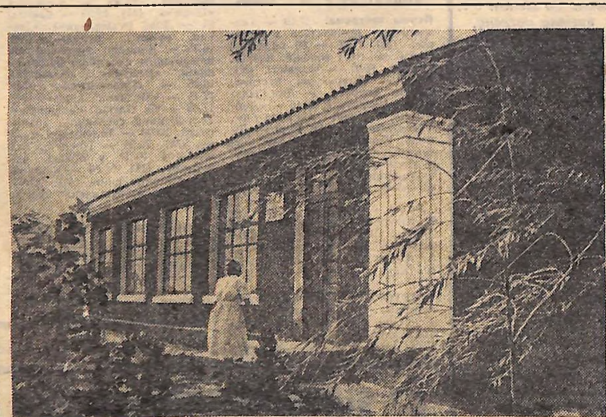
Дрімотна тиша. Молоді дерева, рятуючись від спеки, опустили віття. Та спадає спека, надходить вечір — і все оживає. Дзвенять дітвора, чути веселі голоси. А згодом сповнюється гамором і будинок відпочинку, новий будинок-хресьєнь. Його зовсім недавно передали тваринникам колгоспу імені Суворова Бобринецького району майстри-будівельники.