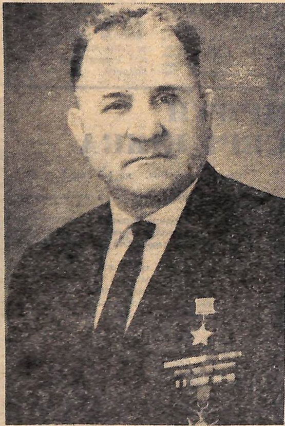
Григорій Васильович БАЛИЦЬКИЙ. Фото 1967 року.

...Живуть і працюють у Кіровограді колишній партизан Герой Радянського Союзу Григорій Балицький і колишня партизанська медсестра Марія Товстенко. Вони одружилися в загоні, разом пройшли війну білоруськими та українськими лісами, там, у лісі, похоронили й сина-немовля... Григорію Васильовичу вже за шістьдесят, все частіше підводить здоров'я. Та коли запитують його про боротьбу з фашизмом, він забуває недуги. І слухає юнх про подвиги батьків, які здохли гитлеризм, відкрили новому поколінню шлях у завтра.