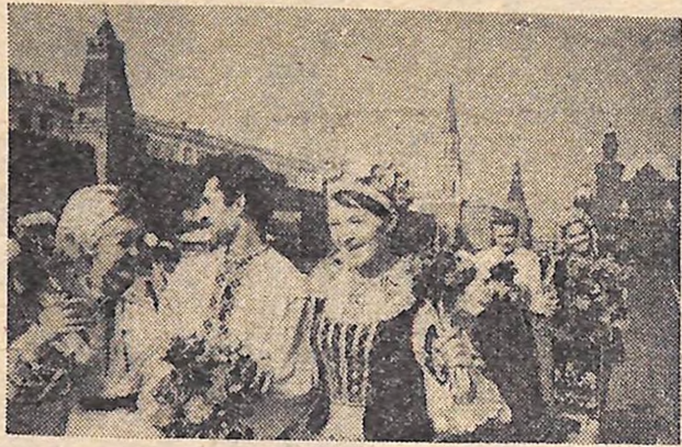
МОСКВА. Дні Української культури та мистецтва. На знімку: артисти Народного хору імені Григорія Вірьовки на Красній площі.

В усіх павільйонах Виставки досягнень народного господарства СРСР розгорнуто експозиції, які розповідають про те, чим багата і славна Україна, який вклад вносить вона у розвиток економіки й культури країни, про те, як зустрічає український народ 50-річчя Великого Жовтня.