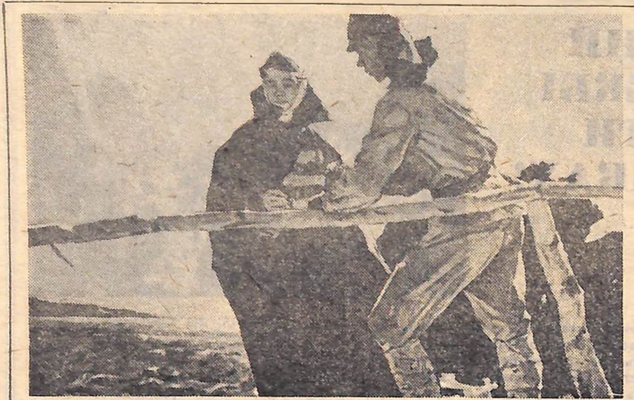
У Києві відкрилася ювілейна художня виставка УРСР, на якій експонуються кращі твори, підготовлені художниками до 50-річчя Жовтня. На фото: картина художника В. Г. Путейка «Червона гвоздика».