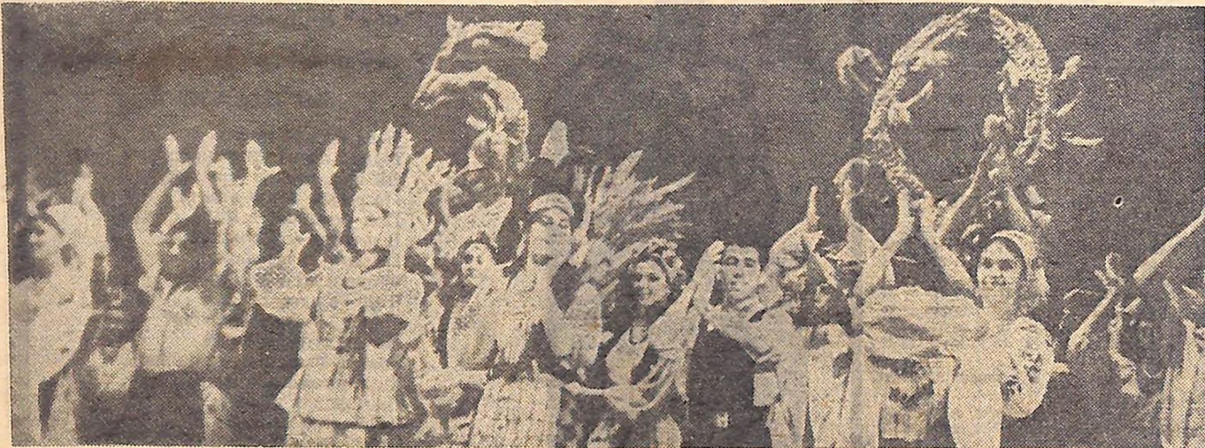
Ще зовсім недавно Кіровоградський заслужений самодіяльний ансамбль УРСР «Ятрань» виступав у Москві, а зараз колектив — у Києві, на фестивалі молоді України. Його знову ждуть сердечні вітання, дружні оплески.

На знімку: хореографічна картина «На шедрих берегах Ятрані».