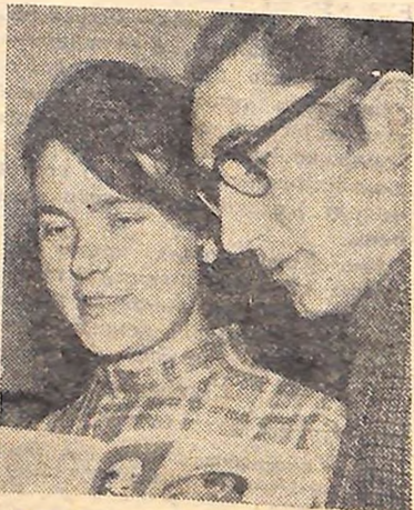
Для вас не байдуже, як справляється суцільна комсомольська організація.

БАТЬКО зрідка появлявся вдома. Вдень разом з татками наймитами як і сам, йшов до панського філярка, вимагав кращої плати, а ночами, а бачив, як у вікно била заграва — то селяни пускали червоного піпця. Невдовзі батька арештували і вислали в Сибір, а через шість років мене забрали в царську армію. Тут мені і довелося служити в одній роті, якою командував вусатий фельдфебель Василь Іванович Чапаєв.