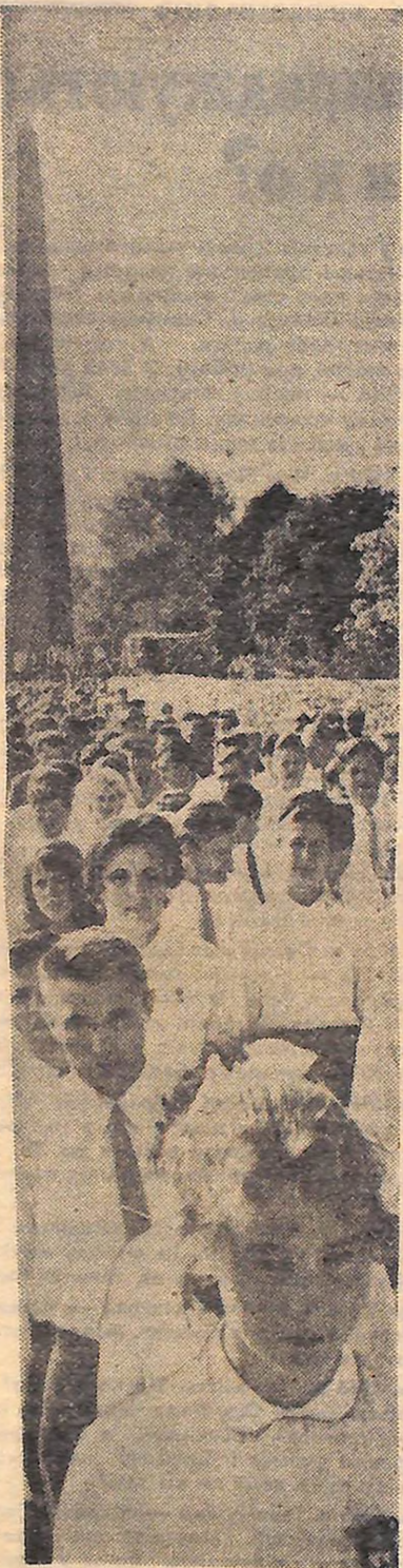
ЦЕ БУЛО НА ФЕСТИВАЛІ. Спільна тиша над високим п'єдесталом. Урочиста тиша. А степівчанин з доброю тривогою. Він приходив сюди поклонитись Невідомому солдату, прийшов ще раз дати клятву, що боронитиме спокою в рідному краю ніколи не буде забутий. Бо ніщо не забуто, ніхто не забутий.