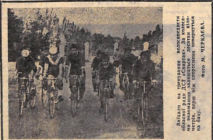
Вихід на тренування велосипедистів обласної ради ДСТ «Спартак». За колесо- ми веломашини замикає десятки кіло- метрів, перш ніж спортсмени повернуться на базу.

руку, сказав: «Ось моя пере- пустка». Ласкаво подивився в очі. На його обличчі засвітила- ся посмішка. Взявши перепуст- ку, я прочитав: «Пред'явник цього Голова Ради Народних Комісарів Ульянов (Ленін)».