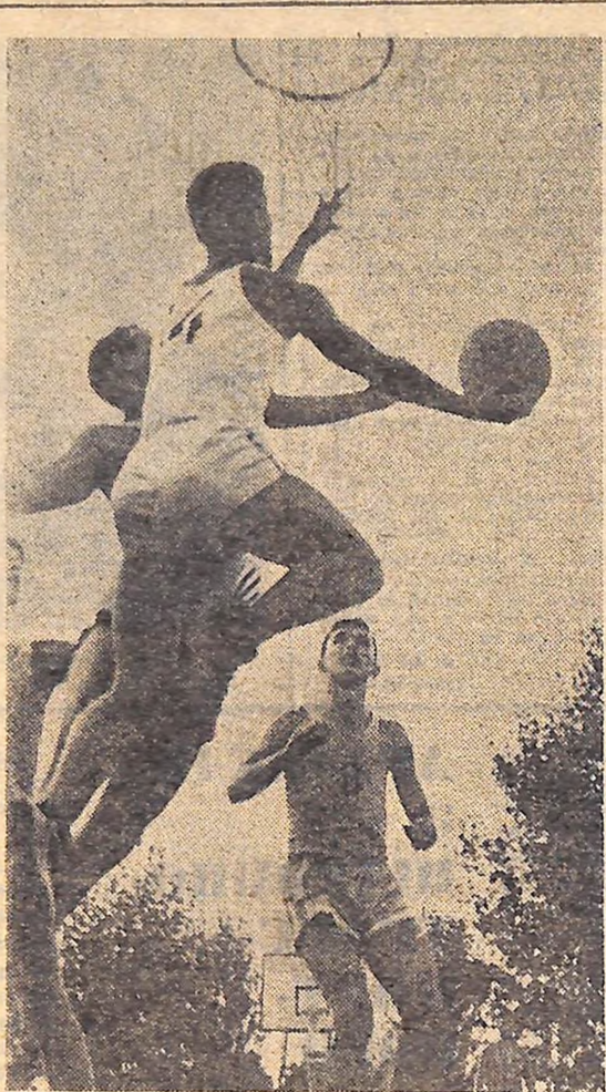
В боротьбі за м'яч.