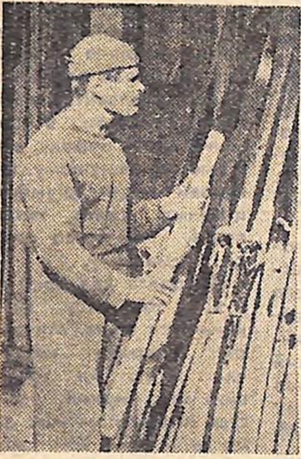
Здрастуйте, лижні! Скоро під вами заскрипить снігова доріжка.

Спортсмени знають, як позначається на силі і витримці навіть недовгочасний