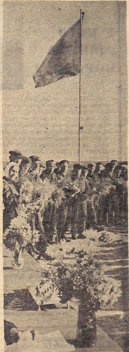
Прапор піднято. Зараз пролунає сигнал — і трактористи з усіх районів області сядуть за важелі. Репортаж про змагання на кращого орача області читайте на другій сторінці.