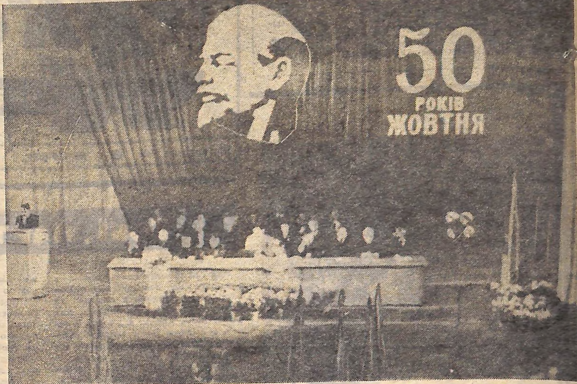
Президія пленуму (фото згорі), на фото ліворуч — в залі засідань.