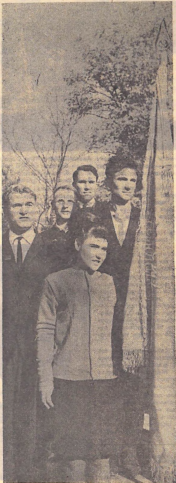
Делегація новоукраїнських комсомольців з пам'ятним прапором ЦК ЛКСМУ.