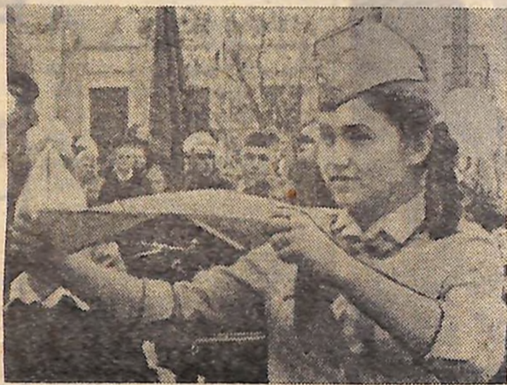
Піонерські рапорти — 50-річчю Жовтня.

книг. Визволяючи місто Зна- м'янку, полягли смертю хоробрих Герой Радян- ського Союзу М. Пана- рин та його друзі Ю. Ко-