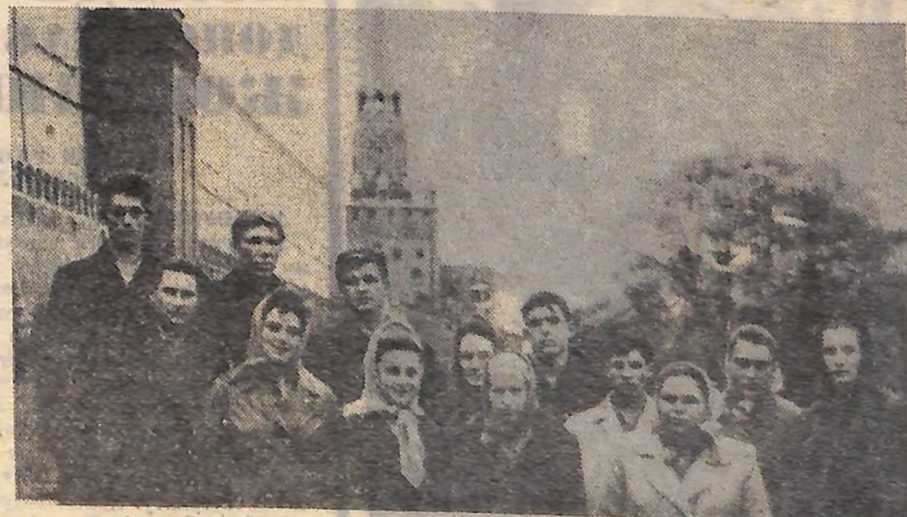
400 молодих звитяжців Кіровоградщини пройшли в жовтні спеціальним парадом по ленінських місцях. Біля стін Мавзоєю В. І. Леніна вони владис партії, вождя, революції на вірність. Серед туристів Буян і хлібороби Ульяновського району . Це загадка про Москву — фотознімок, що зроблений біля кремлівських стін.