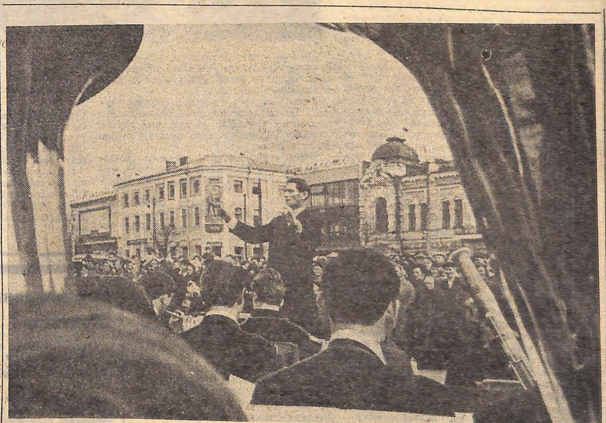
«Чуєш, сурми заграли...» (Свято революційної пісні в Кіровограді).

На виставці, розташованій у міському профтехучилищі № 26, виставлено близько двох тисяч оригінальних, часом незвичайних своєю новизною експонатів. Тут макети Київської ГЕС, шахти «Петровська-Глибока», вугільного комбайна, діючі моделі різних машин і устаткування, телевізори і радіоприймачі з різними цікавими пристроями, зразки сучасного чоловічого і жіночого одягу. Привертають увагу відвідувачів і вироби вихованців училищ прикладного мистецтва — тонко виконане різьблення по дереву, вироби з кераміки, різні скульптури. Особливо оригінальні експонати демонструють учні профтехучилищ Донецького, Дніпропетровського, Київського, Львівського і Запорізького обласних управлінь професійно-технічної освіти.