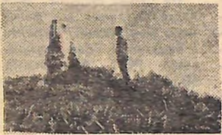
Вона у кожній кровинці, Вона у кожній білинці, Долею молодію Голубиться іздо мною.

В полі ваїти маки. Червоні, немов жарини. А понад них — вітер. Біг поміж пелюсток вітер і від того здавався багряним. На його очі падало небо. Спершу синє-синє, а потім чорне небо летіло на його непокриту голову. А рука пестила маків цвіт. А крізь солдатську сорочку проступала на грудях багряна авітка. І важкий колос склявся над ним, думав свою думу. Потім прийшли дівчата і на могили поклали маки. Проростає той цвіт у мій День, вишумовує над степом багряний вітер. У моєму колосі — його колос. У моєму голосі — його голос. Бо немає тій славі ані кінця ні краю, що широко розпростерла над степом крила червоних прапорів.