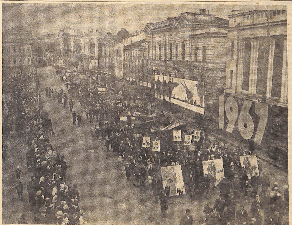
Кіровоград, 7 листопада 1967 року.

В обговоренні і прийнятті листа взяло участь 50 172 759 юнаків і дівчат нашої країни.