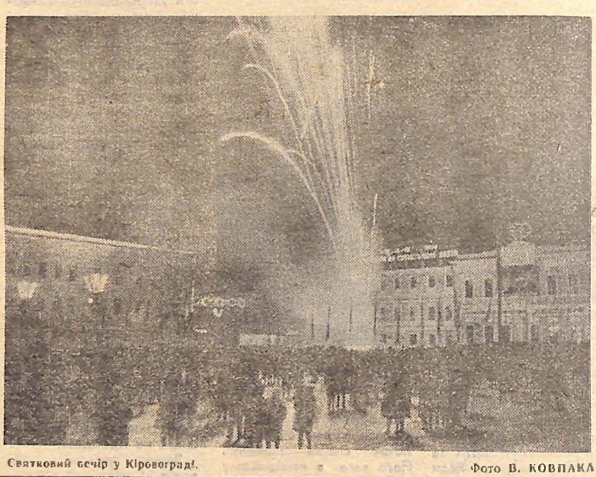
Святковий вечір у Кіровограді.