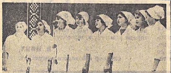
«Ми доярочки-господарочки...» — лінійні сцени Онуфріївського Будинку культури. Співвають мінські дівчата.