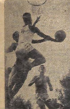
О. ПЕТРОВ. «У боротьбі за м'яч».