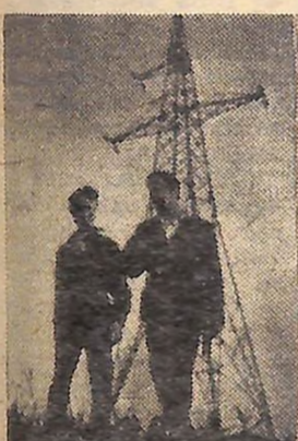
В. ЛОГВИН. «Кроки в майбутнє».