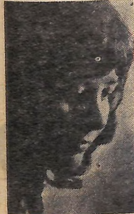
В. ЛОГВИН. «Задума».