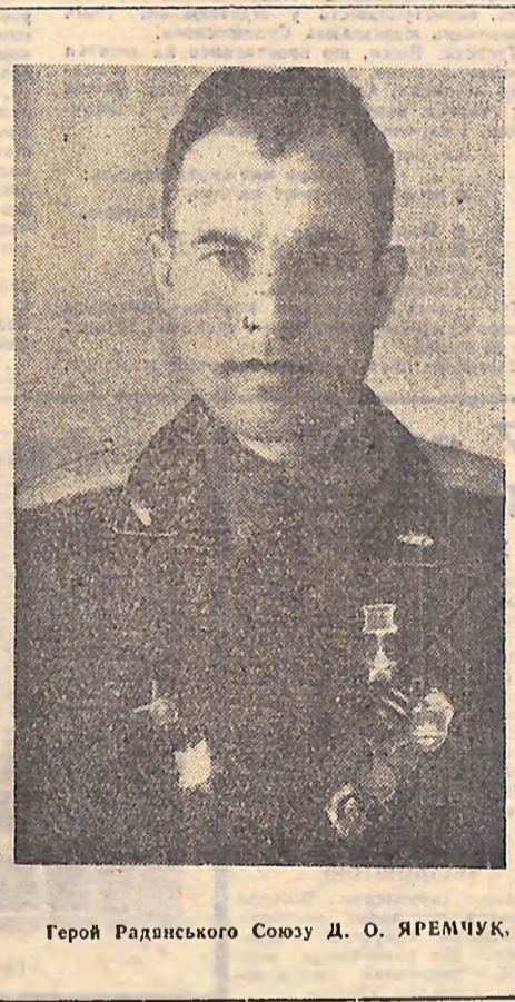
Герой Радянського Союзу Д. О. ЯРЕМЧУК.