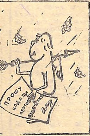
Без слів. Мал. Б. КУМАНСЬКОГО.