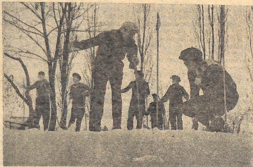
На околиці Олександрівки.