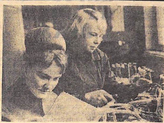
ТОВАРИШ ПРО ТОВАРИША

Збільшенню видобутку нафти сприяє впровадження найновіших досягнень науки і техніки, швидкісних методів проходки свердловин, створення комплексних бригад по видобуванню нафти й інші внутрішні резерви. Свердловини завглибшки 1500—2000 метрів лише 20 років тому бурили більш як рік. Тепер такі свердловини буряться за 15—20 днів, а найкращі бригади проходять їх за 7—10 днів.