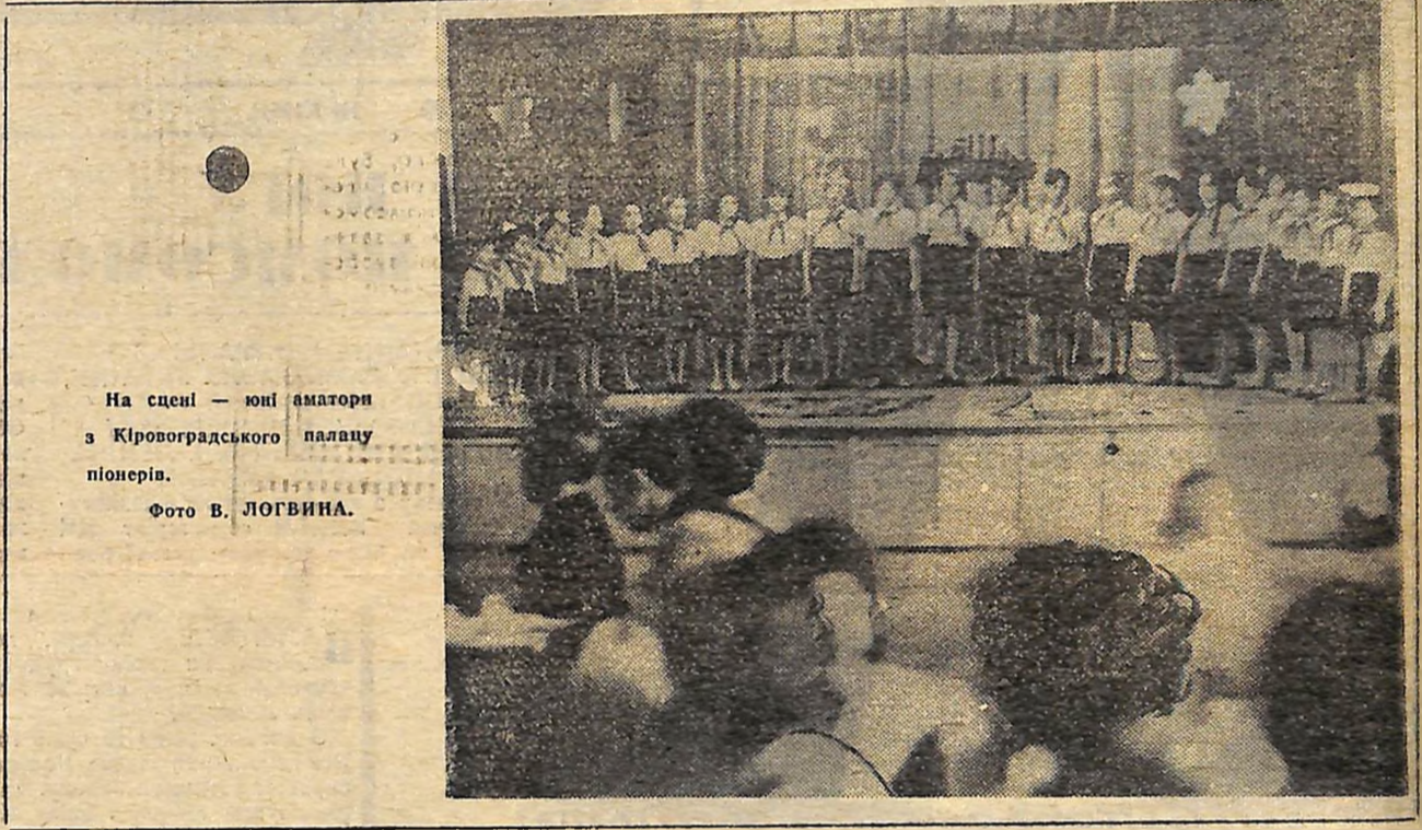
На сцені — юні аматори з Кіровоградського палацу піонерів.

Комсомол закликає піонерів зміцнювати союз серпа і молота, який у боротьбі за владу Рад став запорукою усіх перемог нашої країни. Якщо піонери живуть у місті — хай їх друзями стануть піонери сільської дружини. Якщо школа в селі — потрібно знайти друзів у ближньому місті.