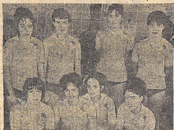
На фото: кремгесівські волейболістки, які завоювали перше місце на обласних змаганнях.