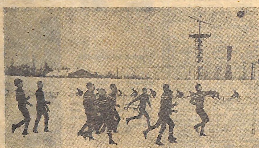
На стадіоні «Юний піонер». Для футболістів і зима не перешкода.