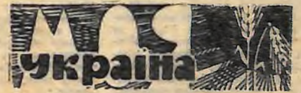
д. з. лютий 1967 р.

лексу ввійдуть планетарій, хіміко-фізична аудиторія, лекторій з двома залами на 1200 і 400 місць, астрономічна обсерваторія.