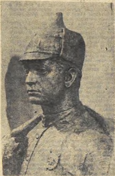
М. М. ТУХАЧЕВСЬКИЙ. Скульптура (алюміній). Автор А. СЕМІНІН. м. Москва.

Квітень 1918 року. Люди раді сонцю в неопаленій Москві. Вночі вони дивляться на зірки. Ніч як день. День турбот, боротьби, гасел... У представника Військового відділу ВЦВК Михайла Миколайовича Тухачевського і вдень і вночі тяжка, кропітка робота. Йому не до сонця. І навіть вночі немає часу, щоб думати про своє. Але він задоволений. Він, мабуть, навіть щасливий. Це шаста клопотів, тривог, шаста діяльності принесла із собою весна. Для нього почалась вона 5 квітня. В цей день його прийняли в партію більшовиків, і в цей же день він вступив до лав Червоної Армії. З цього дня двадцять років він буде чесно і самовіддано служити своїй Батьківщині, своїй партії спочатку командармом, потім командиром, потім командуючим військовим округом, начальником штабу РСЧА, заступником Наркому оборони. На східному фронті проти Колчака, на Кавказькому — проти Денікіна, на Західному — проти білополиків водив Тухачевський червоні війська у вій. Саме йому доручив В. І. Ленін розгромити кронштадтських заколотників у березні 1921 року. Громадянська війна закінчилась. За чотири роки він став визначним воєначальником. Це була тільки перша сторінка життя. Друга його сторінка почалась з будівництва Червоної Армії, з укріплення її могутності, боєдатності. М. Тухачевський став одним із перших маршалів Радянського Союзу. Близькі знали Михайла Миколайовича як доброго товариша, веселого приятеля, турботливого сина і батька.