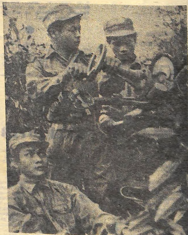
Пильно охороняють рідне небо молоді воїни Лаосу.

В квітні починається новий навчальний рік у вищих і середніх навчальних закладах Японії. Але потрапити до університету чи коледжу зможуть далеко не всі бажані юнаки і дівчата. Адже в новому році підвищується плата за навчання. В багатьох вузах вона сягає таких розмірів, що стає непосильною для сімей робітників і службовців. Як, запитую газета «Асахі», може поступити юнак з сім'ї робітника чи службовця в зуболікарнянський чи інший коледж, якщо лише вступний внесок там складає мільйон ієн? (Середній місячний зарібок японського робітника 35-40 тисяч ієн). Хазяї приватних вищих навчальних закладів, а в них навчається приблизно 80 процентів студентів країни, вирішили підняти в наступному році платню на 40-50 процентів. Громадськість Японії вимагає в уряді покінчити з таким безпросвітним становищем в національній системі освіти. Але, судячи по урядовому бюджету на новий фінансовий рік (він також починається в квітні), якихось змін в статуті японської вищої школи ждати не доводиться. Комітетуна проєкт нового бюджету, японський журнал «Економіста» пише в номері, що бюджет Японії вже протягом десятиліття забезпечує в основному розвиток оборонних сил і системи безпеки. Де вже тут турбуватися за університети? Г. ГАВРИЛЕНКО, кореспондент ТАРС. Токіо.