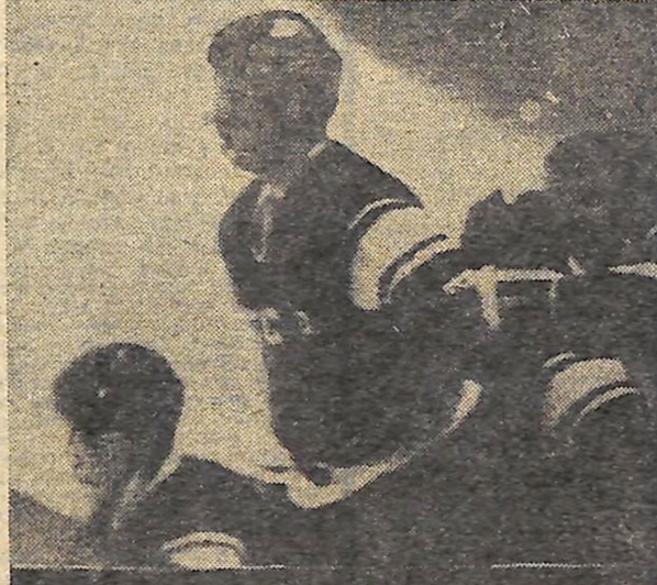
У ворота суперників закинуто ще одну шайбу!