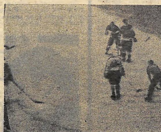
Матч СРСР — Швеція. Зараз арбітр введе шайбу в гру.