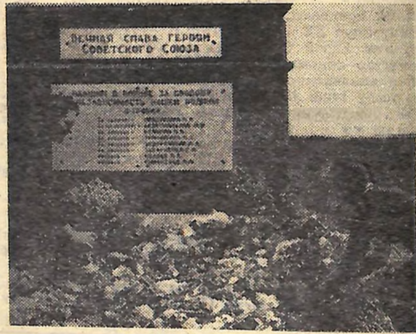
Пам'ятник восьми героям в Криму.

Кожної весни, коли кримська земля уквітчується зеллом, селом Геройським проходить чоловік, посріблений сивиною. Він наближається до могили, в якій сплять вічним сном вісім Героїв. ...Ворог відступав. Впали перекопські укріплення фашистів. Гітлерівці скажешли. Вони зізнали чоловіків і юнаків до сільського клубу.