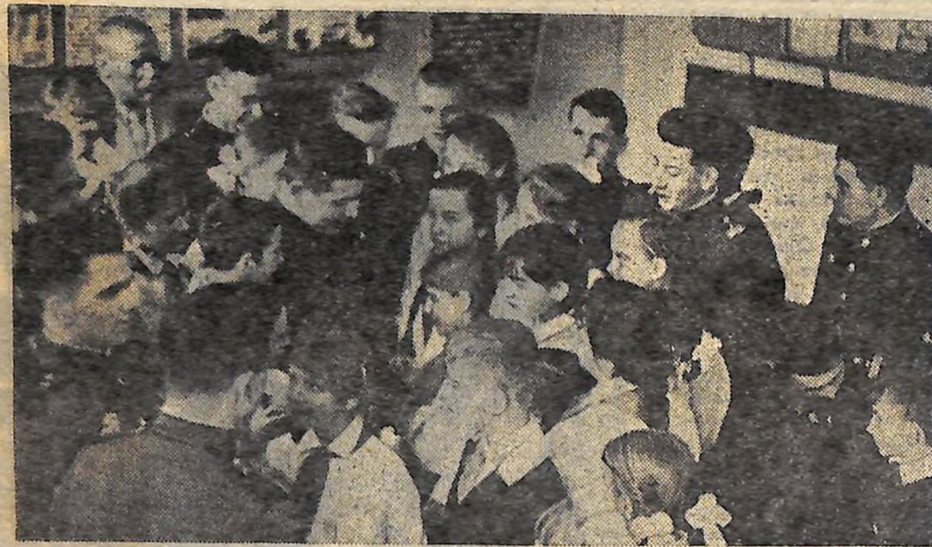
День відкритих дверей у військовій частині м. Кіровограда. В гості до воїнів прийшли учні міста та Кіровоградського району.

ВІД РЕДАКЦІЇ. В своєму листі воїни надіслали вірші про наш степовий край, про солдатську ратну працю. Ми дякуємо наших земляків за теплі рядки і щиро поздоровляємо їх в 50-річчя Радянської Армії і Військово-Морського Флоту.