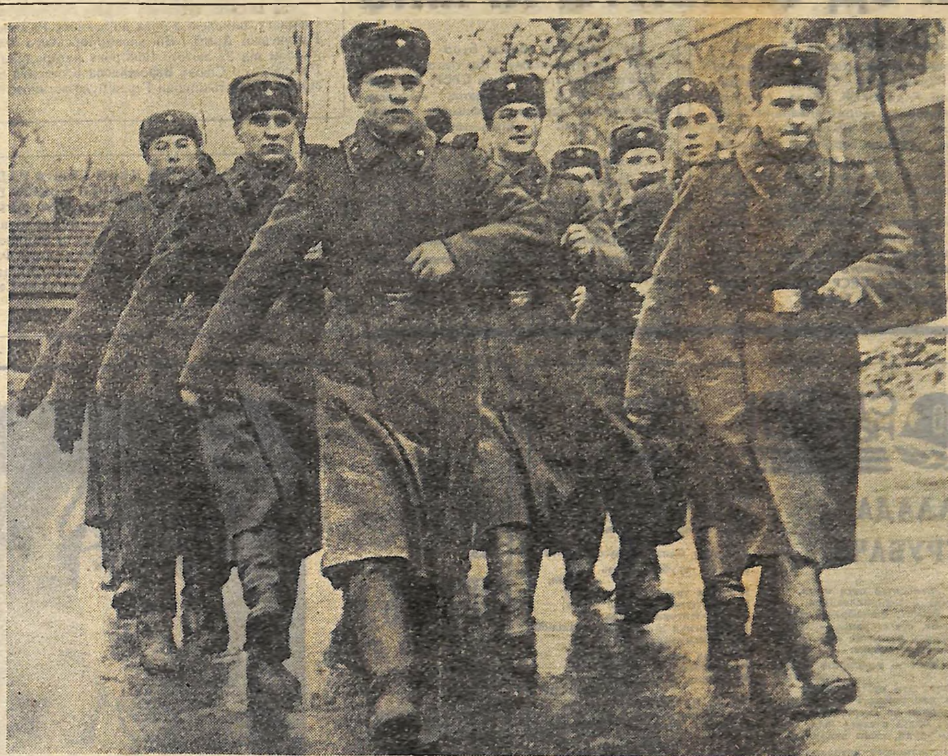
У ВОЇНІВ ГАРНИЗОНУ

Ідуть солдати одного з підрозділів військової частини м. Кіровограда.