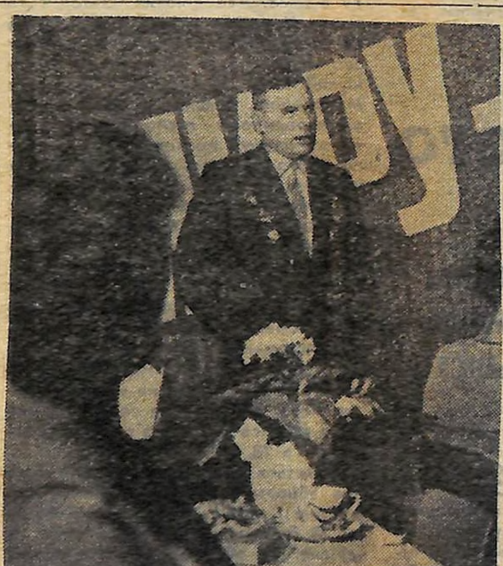
«Вогник» працівників ЦУМу в Кіровоградському клубі держоргівлі, присвячений 50-річчю Збройних Сил СРСР. Виступають учасники Великої Вітчизняної війни.

ЖЕНЕВА, 22 лютого. (ТАРС). Європейський союз футболних асоціацій (УЕФА) опублікував сьогодні остаточні дати чвертьфінальних матчів на Кубок європейських чемпіонів і Кубок володарів кубків. Учасники другого турніру — московські торпедівці зустрінуться з командою «Кардифф-сіті» (Уельс) 3 березня в Кардиффі і 19 березня в Ташкенті. Раніше перший матч намічався провести 28 лютого, а потім 6 березня.