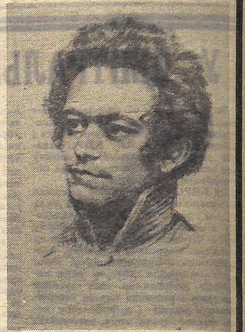
К. МАРКС — студент.

Якщо ми вибрали професію, в рамках якої ми більше всього можемо працювати для людства, то ми не зігнемось під її тягарем, тому що це — жертва в ім'я всіх; тоді ми відчуємо не маленьку, обмежену, егоїстичну радість, а наше щастя буде належати мільйонам, наші справи будуть жити тоді тихим, але вічно діючим життям, а над нашим прахом проллються гарячі сльози благородних людей.